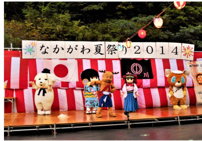
ゆるキャラたちも大集合！