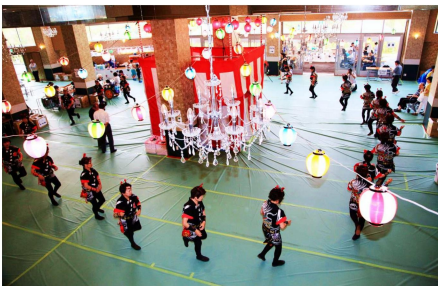
夏祭り みんなで盆踊り