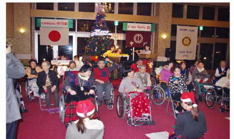
クリスマスパーティで合奏しました